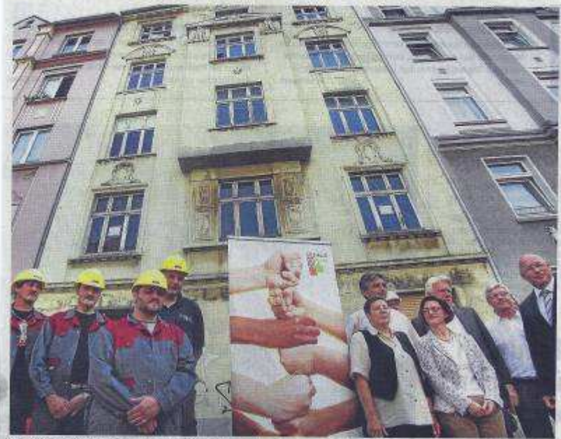
Viele Verfechter für eine lebenswerte Nordstadt ziehen an einem Strang, um die heruntergekommene Immobilie an der Brunnenstraße 51 zu sanieren.