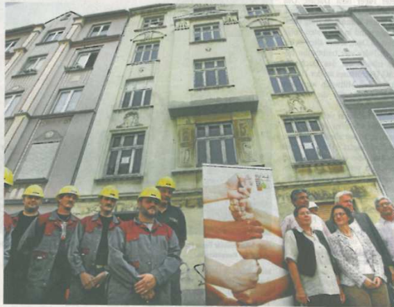
Viele Verfechter für eine lebenswerte Nordstadt ziehen an einem Strang, um die heruntergekommene Immobilie an der Brunnenstraße 51 zu sanieren.

Das Spektrum der Lern- und Qualifizierungsangebote reicht über Abrucharbeiten, Trockenbau, Maler, Tapezier- und Putz-